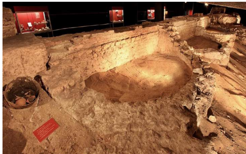
Crypte archéologique (24 rue Cazade) Parcours d'exposition permanent gallo-romain